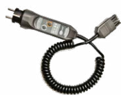
WS-01 adattatore con pulsante di START e spina UNI-SCHUKO