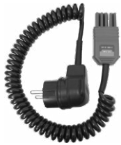
WS-05 adattatore con spina UNI-SCHUKO angolare