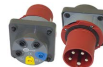
Adattatore presa trifase industriale 63 A