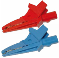
Coccodrillo 1 kV 20 A rosso / blu