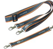
Set di imbracature per il multimetro L-2