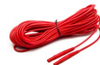
Cavo di prova per la misura dell'anello di guasto (terminale banana) 5 m / 10 m / 20 m