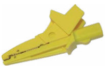
Coccodrillo 1 kV 20 A giallo