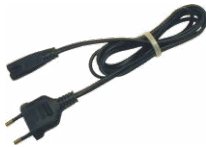
Cavo di rete 230 V (IEC C7)