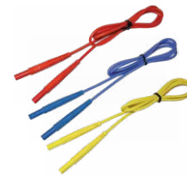
Cavi di prova 1,2 m (terminale banana) rosso / blu / giallo